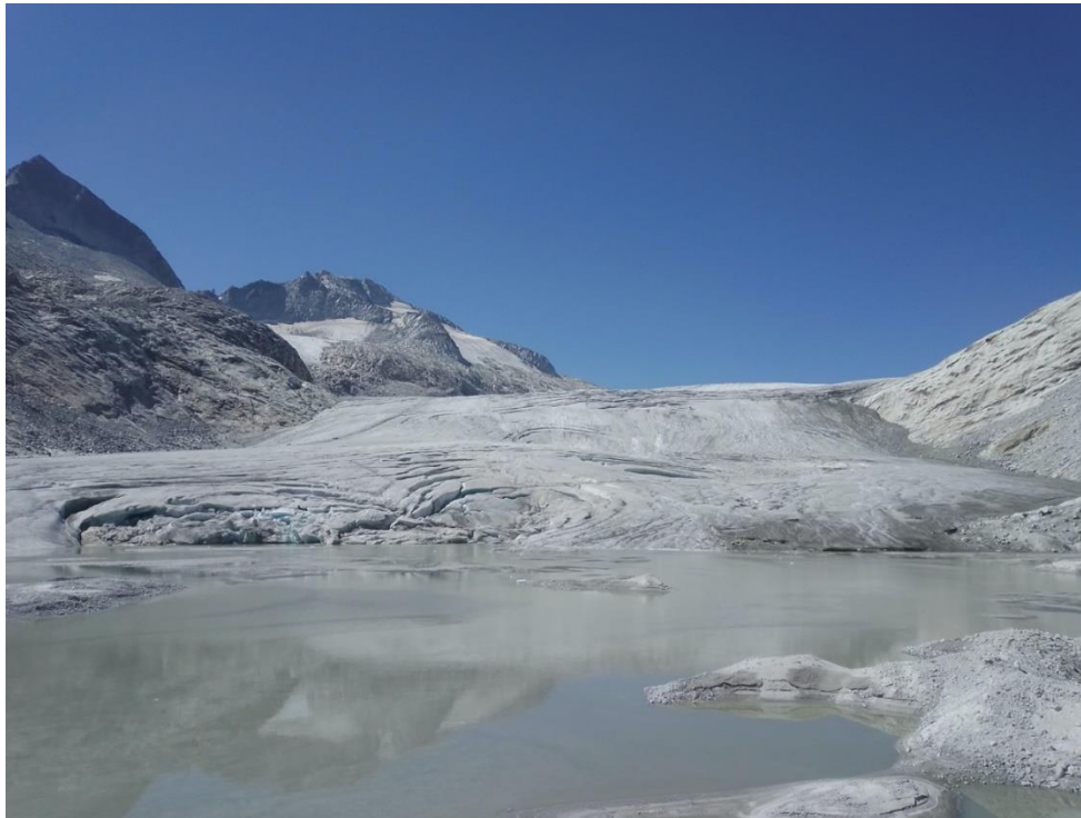
Figura 2 - Il “lago nuovissimo” formatosi presso la fronte del Ghiacciaio dell’Adamello ripreso il 18 luglio 2022

Le temperature dell’aria presso la diga di Pantano d’Avio, ai piedi del Monte Adamello sul versante lombardo, sono aumentate di circa 0.4^{\circ}\text{C} ogni dieci anni, con effetti molto gravi anche sul permafrost, la cui fusione rende instabili le pareti rocciose e aumenta il pericolo per gli alpinisti.